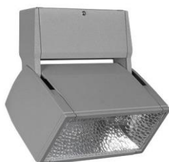
Anbaumontage // surface mounted